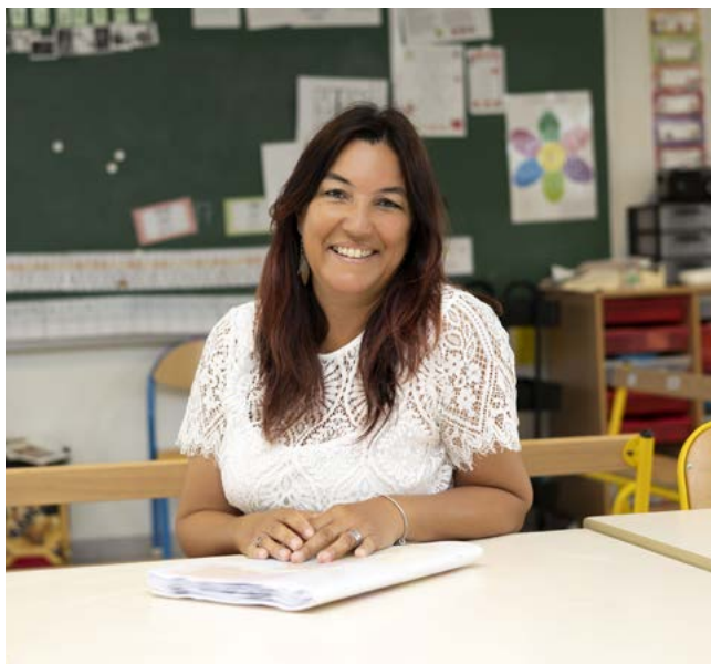
*Agent Territorial spécialisé des Ecoles Maternelles