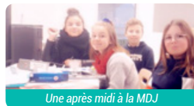
Une après midi à la MDJ