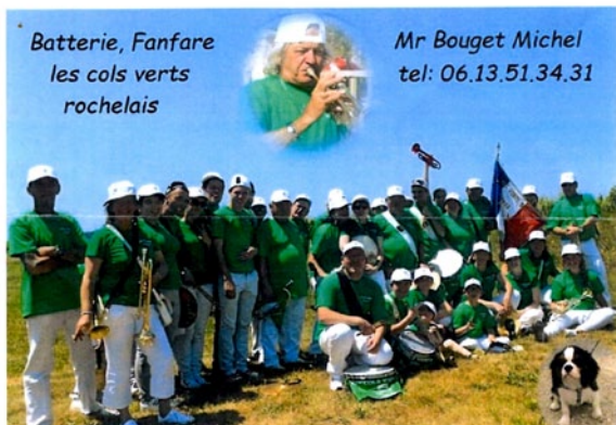
Batterie, Fanfare les cols verts rochelais